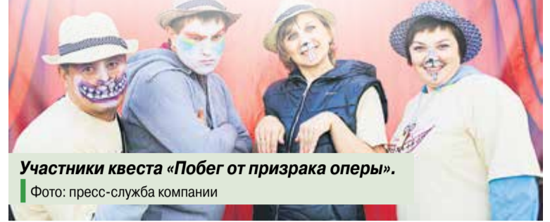
Участники квеста «Побег от призрака оперы».