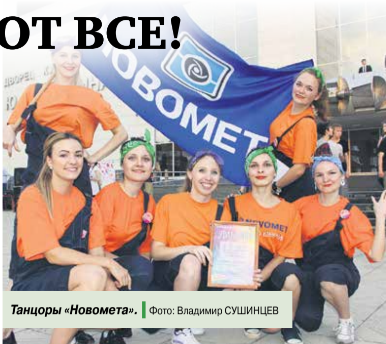
Танцоры «Новомета».

Конкурс включал в себя несколько этапов. В «Визитке» все команды ярко с костюмами и атрибутами показали свои танцевальные номера.