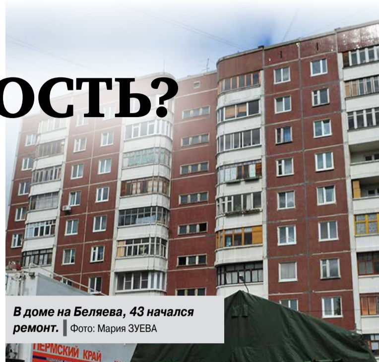
В доме на Беляева, 43 начался ремонт.

В районе продолжает свою работу межведомственная комиссия по признанию жилых помещений не пригодными