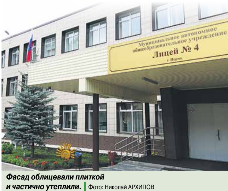
Фасад облицевали плиткой и частично утеплили.

ском и социальном сотрудничестве между правительством Пермского края и нефтяной компанией «ЛУКОЙЛ».