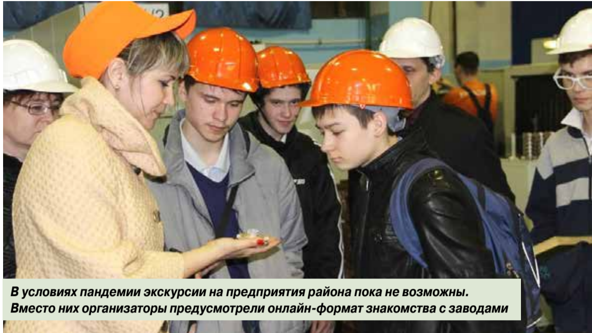
В условиях пандемии экскурсии на предприятия района пока не возможны. Вместо них организаторы предусмотрели онлайн-формат знакомства с заводами

На второй этап — районную онлайн-конференцию школьников 10–11-х классов образовательных организаций Индустриального района г. Перми «Моя профессия» 29 апреля 2020 года — организаторы отобрали 11 работ. Работы получились интересными, разноплановыми.