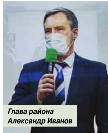
Глава района Александр Иванов

Участникам рассказали о мероприятиях, посвящённых 75-летию окончания Второй мировой войны, а также о практике социальной поддержки и защиты участников войны. Состоялась презентация районного проекта «Дорога памяти», рассказали о деятельности школьного поискового отряда «Непобеждённый Гангут» на базе школы №132 города Перми.