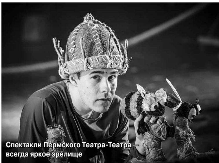
Спектакли Пермского Театра-Театра — всегда яркое зрелище

Днем 21 июня распахнул свои двери для маленьких зрителей уютный зал ДК им. Ю.А. Гагарина. Дети увидели