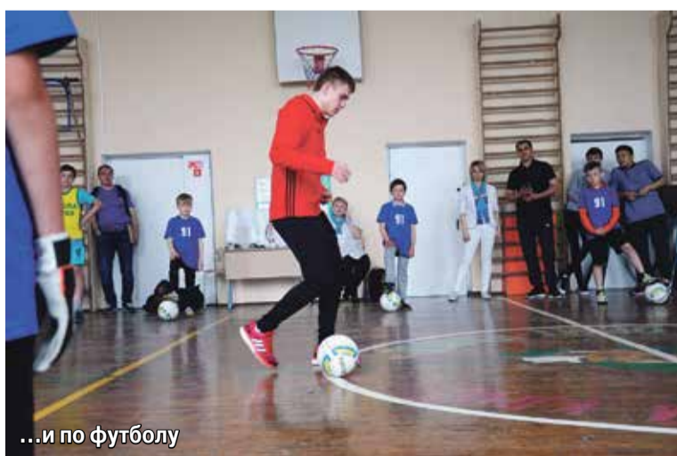
...и по футболу