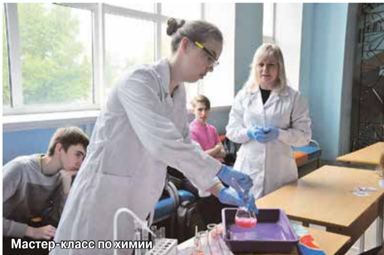
Мастер-класс по химии