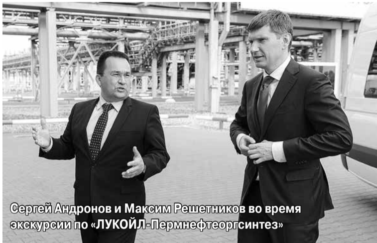
Сергей Андронов и Максим Решетников во время экскурсии по «ЛУКОЙЛ-Пермнефтеоргсинтез»

«Сегодня мы посетили два предприятия-лидера пермской промышленности — «Гознак» и «ЛУКОЙЛ-Пермнефтеоргсинтез». Предприятия много вкладывали в свое развитие в последние годы, при этом у каждого из них есть план дальнейших действий и вопросы к региональным, городским властям, которые нужно решить, чтобы эти планы реализовались. Это вопросы, касающиеся землеотводов, ком-