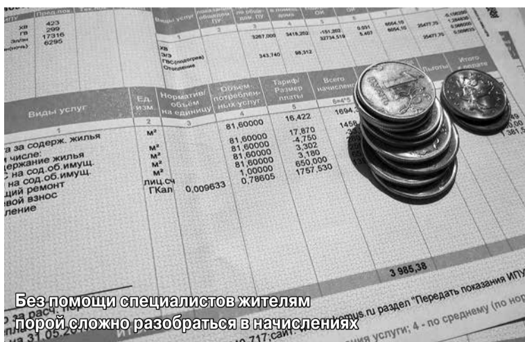
Без помощи специалистов жителям порой сложно разобраться в начислениях