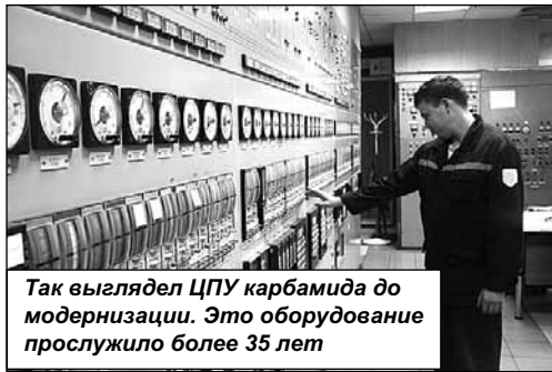
Так выглядел ЦПУ карбамида до модернизации. Это оборудование прослужило более 35 лет