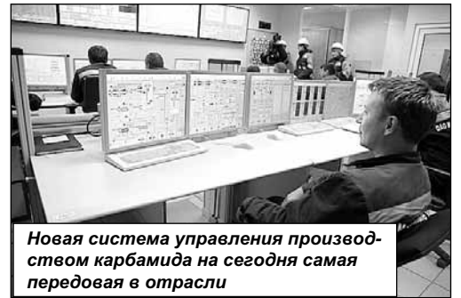
Новая система управления производством карбамида на сегодня самая передовая в отрасли